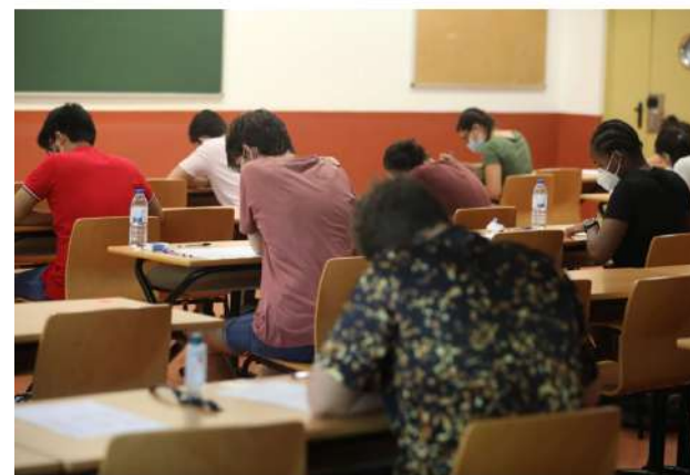
Varios estudiantes se examinan en 2020 de las pruebas de la Evaluación de Acceso a la Universidad, en las instalaciones de la Rey Juan Carlos en Móstoles.

Un centro de Móstoles manda un correo a los profesores para que aporten dinero con el que pagar el examen de varios estudiantes. CC OO estima que hay 7.500 menores en la región en esa situación