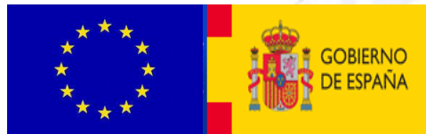
INSTITUCIONES Y GOBIERNOS