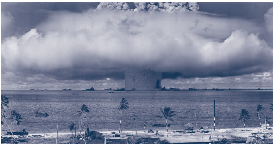
Ensayo nuclear en la República de las Islas Marshall, en julio de 1946

La persistencia en el desarrollo de las armas nucleares no solo contradice el espíritu de la Carta de las Naciones Unidas en su artículo 26 –que invita a lograr «la menor desviación posible de los recursos humanos y económicos del mundo hacia los armamentos»–; sino que, además, perpetúa cruelmente un orden mundial distorsionado, que impone condiciones peligrosas y