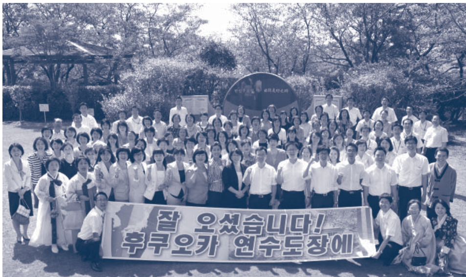
Jóvenes coreanos visitan Kyushu como parte del intercambio amistoso Corea del Sur-Japón, en septiembre de 2011

Para los participantes, la experiencia de compartir esfuerzos para responder a problemas ambientales o a situaciones de emergencia deja un saldo invaluable, e inculca en ellos la certeza de estar creando su propio futuro. Además,