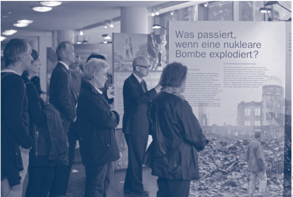
Exposición antinuclear de la SGI en Berlín, Alemania, en octubre de 2011

La SGI, en su labor conjunta con otras organizaciones no gubernamentales, ha sido una de las primeras propulsoras