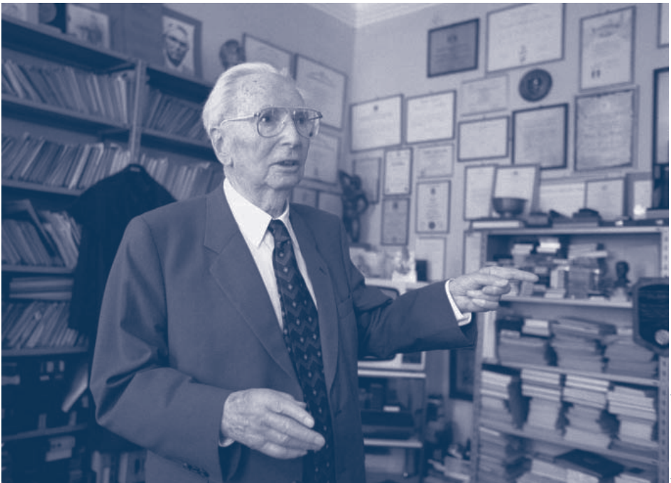
Viktor E. Frankl

En otras palabras, si alguien es capaz de sobrellevar las aflicciones y las pruebas más terribles sin perder la fe en el sentido de la vida, su actitud puede convertir una