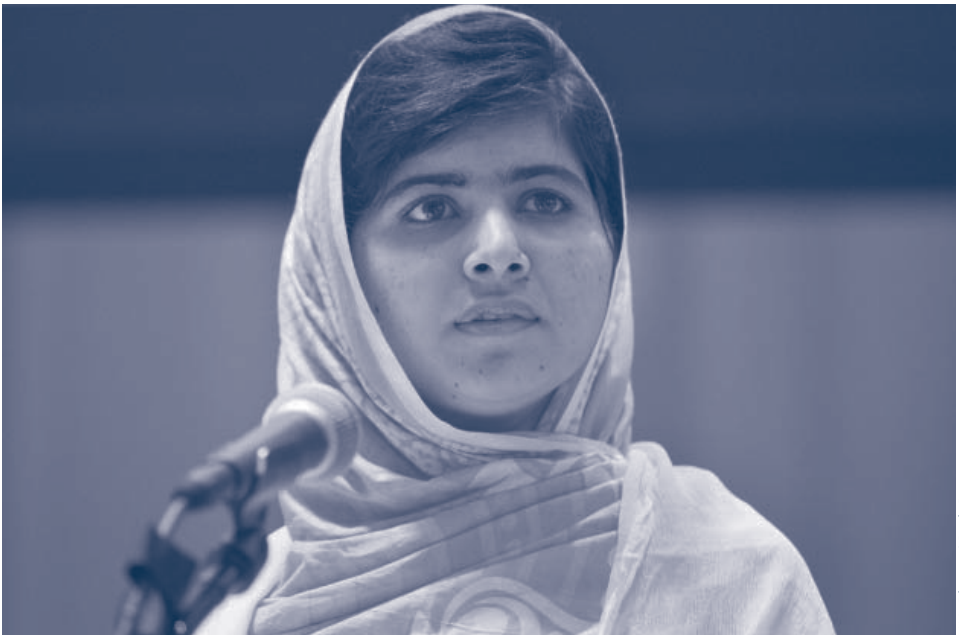
Malala Yousafzai habla en el Foro Juvenil “Día de Malala” de las Naciones Unidas en Nueva York, en julio de 2013

Hace dos años, un hombre del régimen talibán disparó en la cabeza a la joven Malala Yousafzai por defender públicamente la educación de las jóvenes en su Pakistán natal. Sobrevivió a sus gravísimas heridas y se recuperó